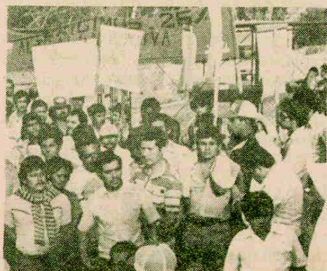
Los obreros no reaccionaron a tiempo.

El Consejo Hondureño de la Empresa Privada (COHEP) definió en 5 puntos su posición sobre el pago del