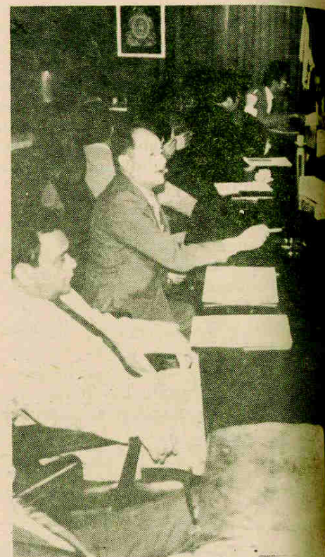
El presidente Roberto Suazo Córdova con el documento denominado “Estrategia para el FMI.”

En resumen, de acuerdo a los términos liberales, “con este nuevo concepto de desarrollo se están ahora sentando las bases para emprender el camino hacia una estabilidad económica, política y social... Se trata de