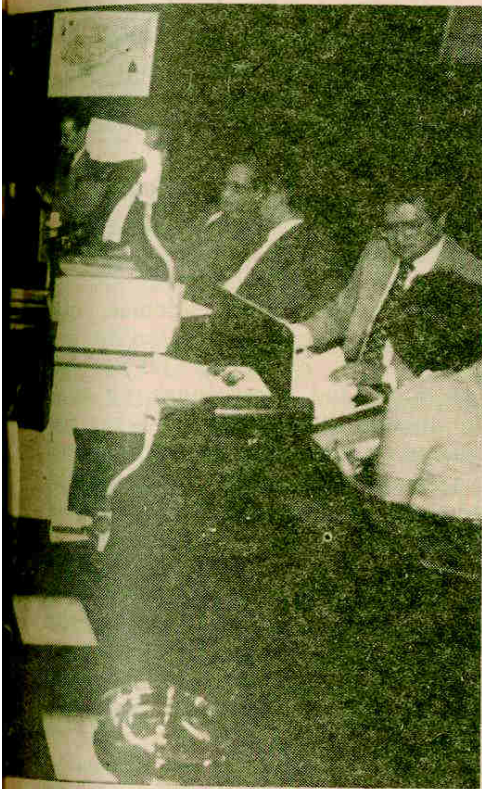
su gabinete ministerial aprobó un documento y en el cual se aplican los consejos

Muy pocas armas para tan ardua batalla. El pueblo lo sabe y, entre desesperado y expectante, espera el resultado de la "nueva" política económica del gobierno que encabeza Roberto Suazo Córdova.